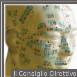
Il Consiglio Direttivo

Fondata nel 1968 la Società Italiana di Agopuntura riunisce i medici italiani interessati allo studio, all'approfondimento, all'applicazione ed alla divulgazione dell'agopuntura e degli altri aspetti della Medicina Tradizionale Cinese. Tale finalità è perseguita attraverso varie iniziative culturali e scientifiche.